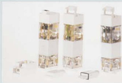
Schamlos imitiert: Synchron-Motor Elektra...