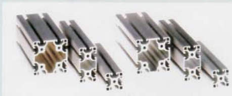
und ein Profilsystem der Solinger item GmbH

schen Ländern gefälscht worden. „Anfang 2002 beobachteten wir dann aber das Auftauchen des plagiierten TS 400, und der ist nicht nur ein leistungsstarkes, solides Baugerät für Profis, sondern so ganz nebenbei der weltweit meistverkaufte Trennschleifer aus unserem Haus“, so der Stihl-Anwalt.