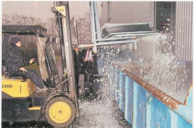
Von SGG durchgesetzt: die Vernichtung der MASTER-CARRÉ-Plagiate

Ergänzend wird für Produktnamen Markenschutz beantragt. Der Geschmacksmusterchutz erfasst nach Definition des Deutschen Patent- und Markenamtes „die Erscheinungsform eines ganzen Erzeugnisses oder eines Teils davon. Die Erscheinungsform kann sich insbesondere aus den Merkmalen der Linien, Konturen, Farben, der Gestalt, Oberflächenstruktur oder der Werkstoffe des Erzeugnisses selbst oder seiner Verzierung ergeben“.