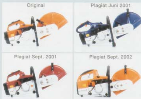
...und der Stihl-Trennschleifer TS 400,...