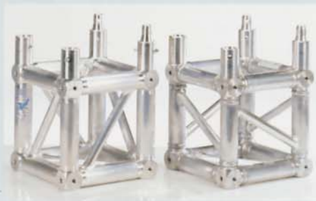
...das Knotenelement von PROLYTE PRODUCTS...